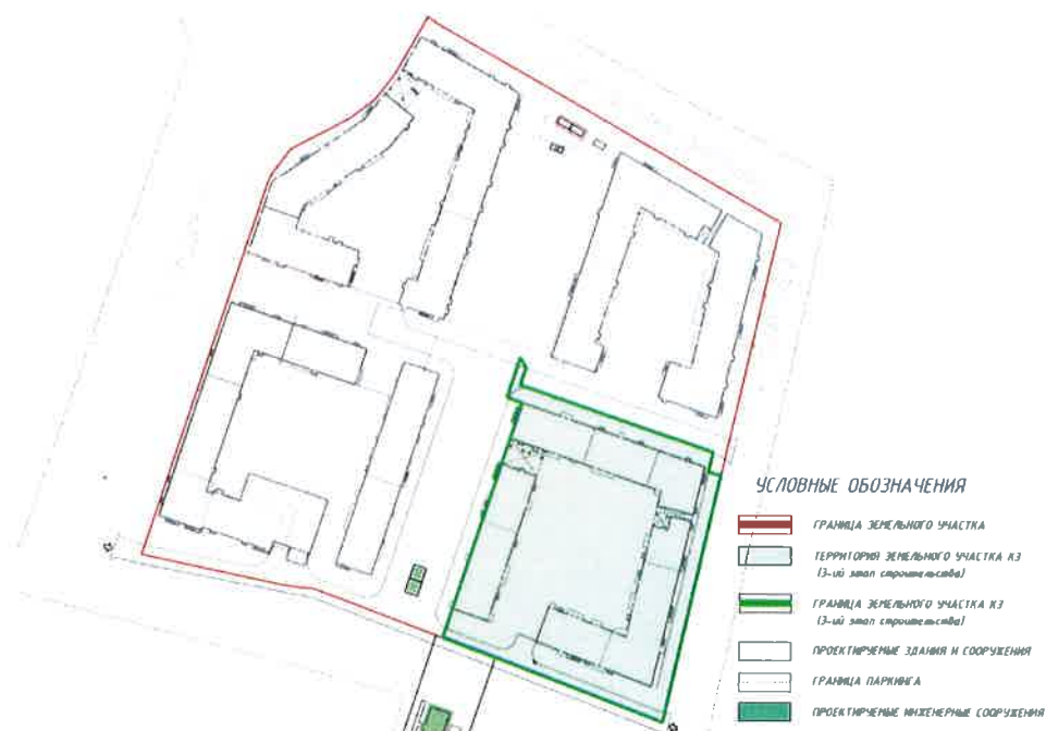
СХЕМА РАЗМЕЩЕНИЯ ОБЪЕКТА

Приложение №2 к Изменению №3 от 11.07.2017 г. в Проектную декларацию от 15.02.2017 года, опубликованную на сайте www.bonava.ru О проекте строительства Многоквартирного жилого комплекса со встроенно-пристроенными помещениями, встроенно-пристроенными объектами дошкольного образования и встроенно-пристроенным подземным гаражом по адресу: г. Санкт-Петербург, Аптекарский проспект, д.16, лит.Б, кадастровый номер земельного участка 78:07:0003299:1234 3 этап строительства (секции К31-К39)